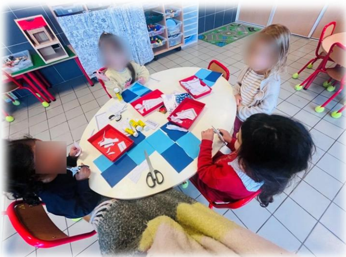
Polynésie, la mer d'Henri Matisse